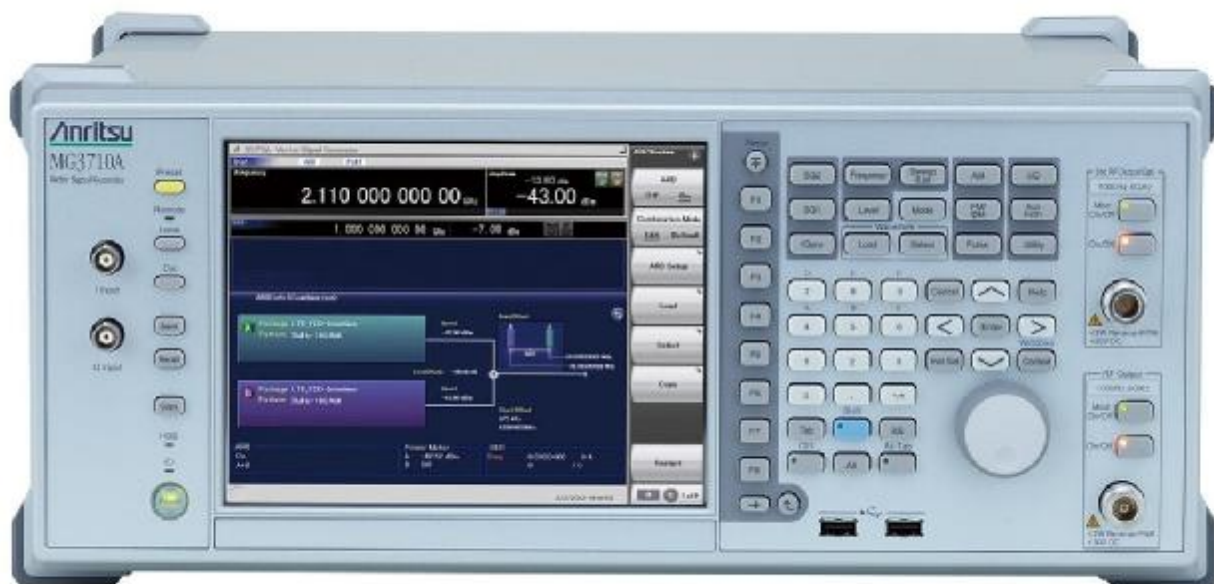
Фотография 1. Лицевая панель