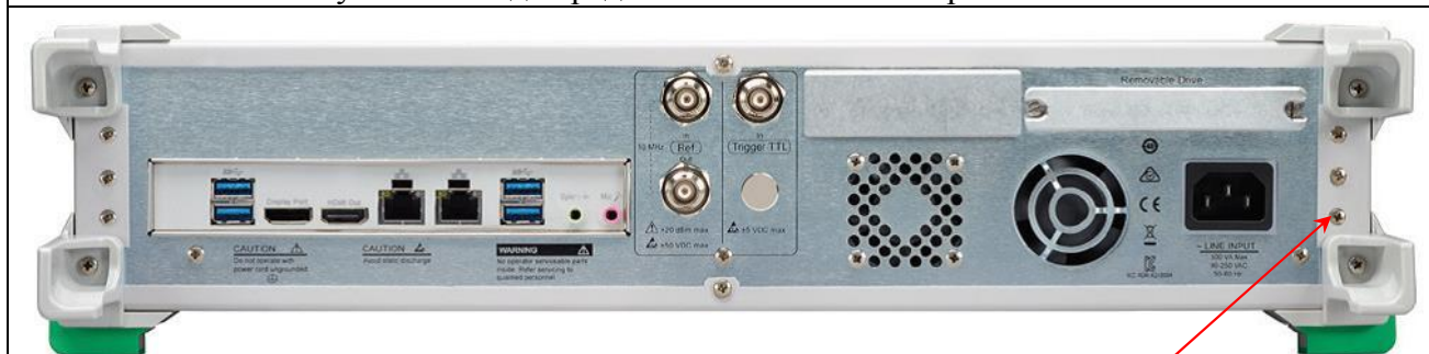
Рисунок 3 – Вид передней панели анализаторов MS46322B

место нанесения знака утверждения типа и знака поверки