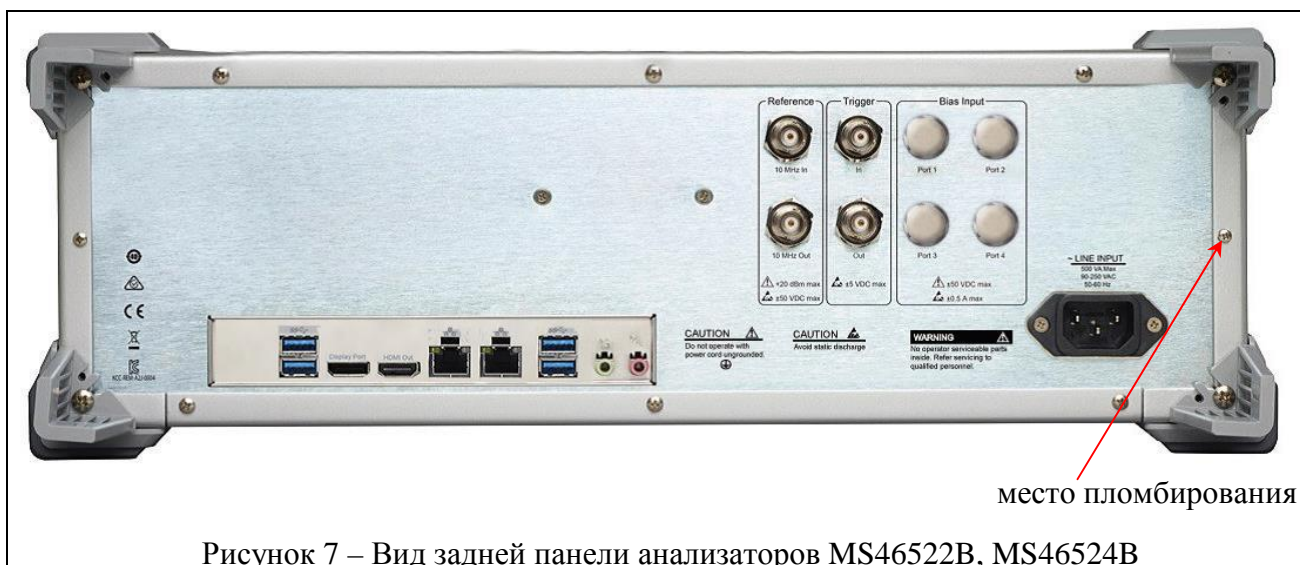
Рисунок 7 – Вид задней панели анализаторов MS46522B, MS46524B