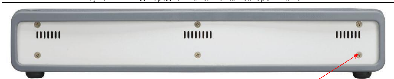
Рисунок 1 – Вид передней панели анализаторов MS46122B

место нанесения знака утверждения типа и знака поверки