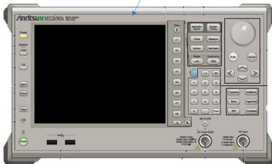
Рисунок 1 - Внешний вид передней панели анализаторов

Архангельск (8182)63-90-72 Астана (7172)727-132 Астрахань (8512)99-46-04 Барнаул (3852)73-04-60 Белгород (4722)40-23-64 Брянск (4832)59-03-52 Владивосток (423)249-28-31 Волгоград (844)278-03-48 Вологда (8172)26-41-59 Воронеж (473)204-51-73 Екатеринбург (343)384-55-89 Иваново (4932)77-34-06